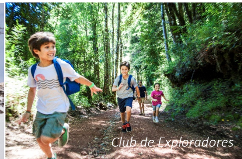
Club de Exploradores