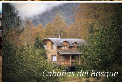
Cabañas del Bosque