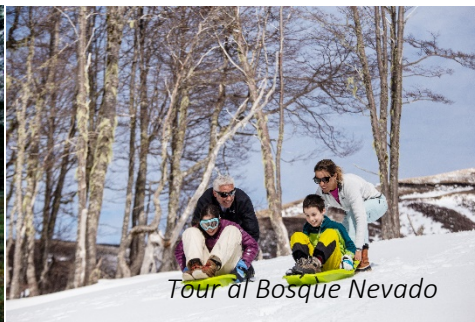
Tour al Bosque Nevado