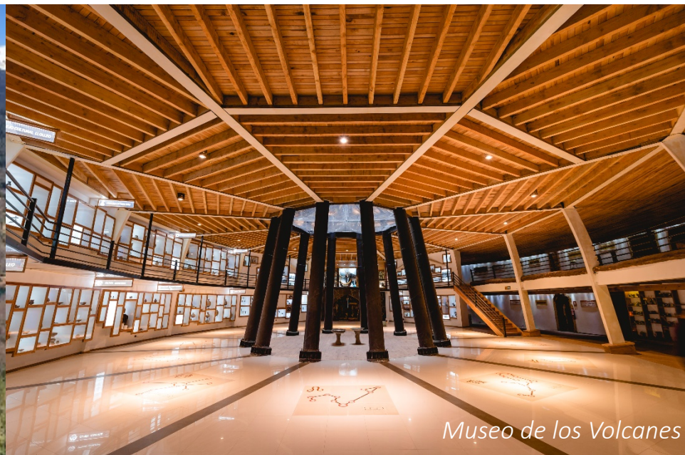
Museo de los Volcanes