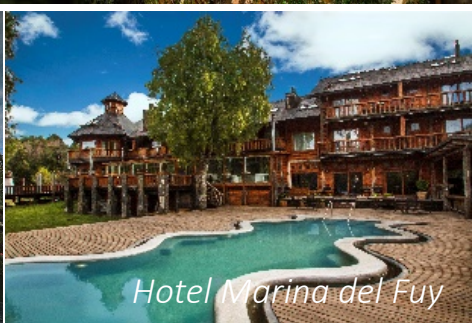
Hotel Marina del Fuy