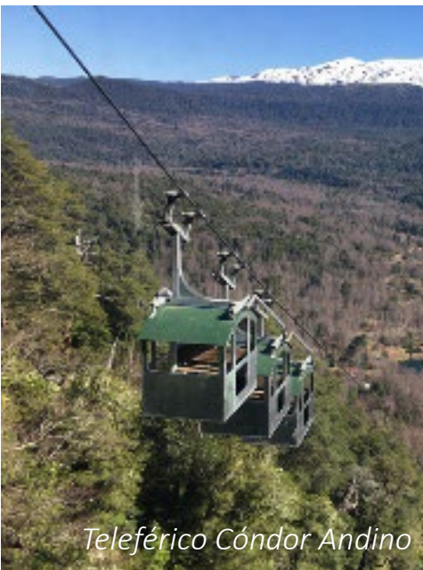
Teleférico Cónдор Andino