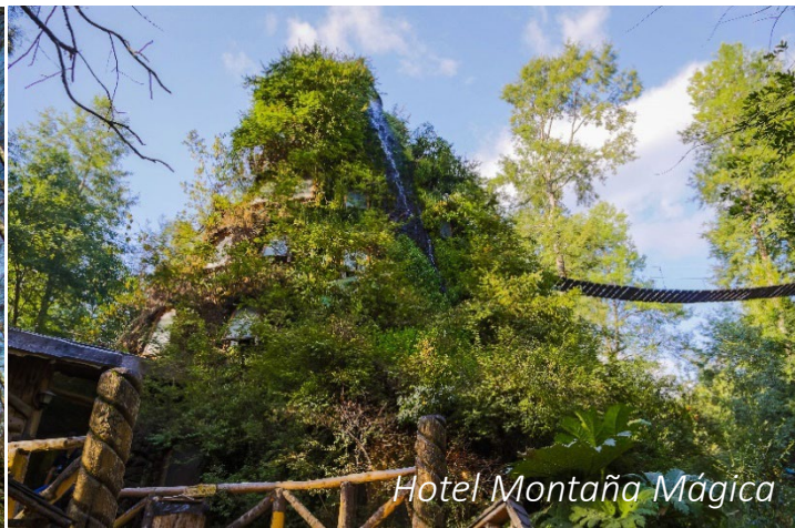
Hotel Montaña Mágica