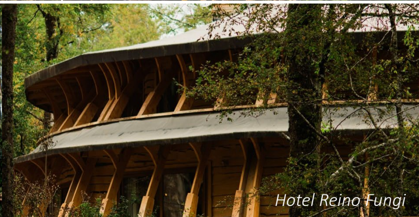
Hotel Reino Fungi